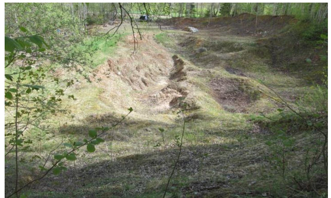
Visus teritorijas attīrīšanas darbus veicām paši talku veidā