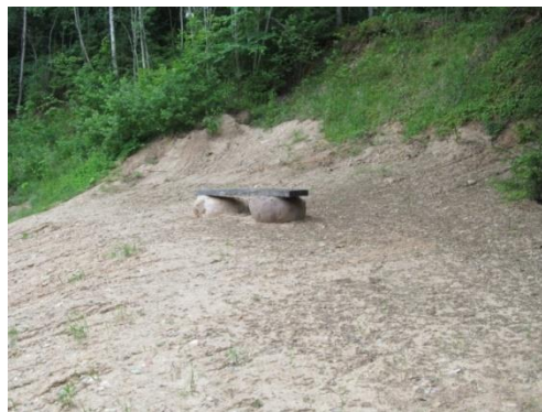
Pēc līdzināšanas, atkritumu izvešanas un aprakšanas - 2014.gada pavasaris