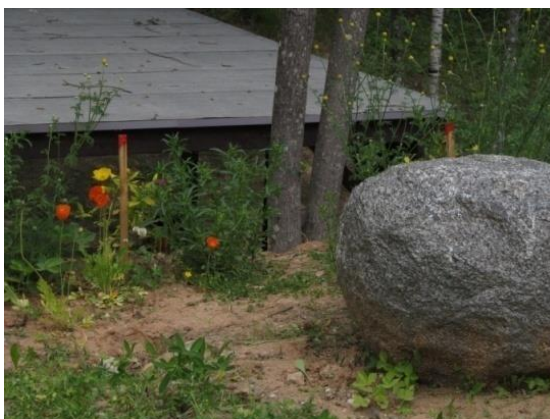
Skats uz nojumi no „amfiteātra” puses 2015. gads