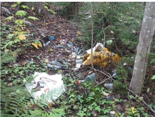
Atkritumu vākšana - 2013.gads