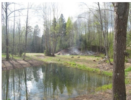
Dīķis 2015.gada vasara