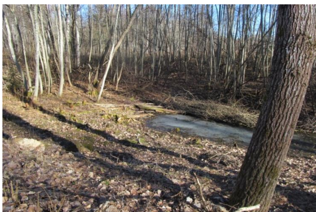
Dīķa vieta 2014.gada pavasaris