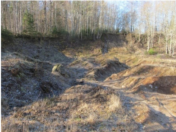
Tā 2013.gadā izskatījās pēc krūmu izciršanas