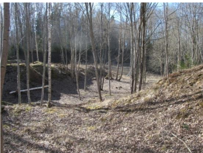
Iztīrīta vieta nojumei 2014.gada pavasaris