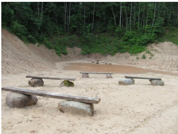
Dabiskais amfiteātris, kur veidosim smilšu terapijas klasi